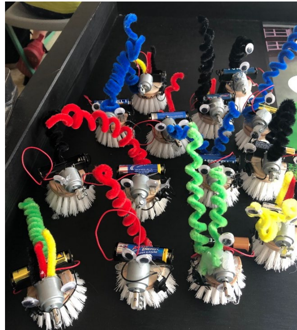
Abb.: „Bürstenroboter“ - Projekt in Klasse 5