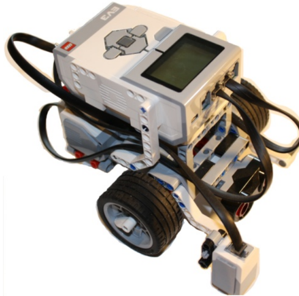
Abb.: Das Grundmodell des Roboters mit dem EV3-Stein

Grundlage für den ROBOTIK-Unterricht ist das Grundmodell „ LEGO MINDSTORMS Education EV3 “. Angesteuert wird der „EV3“ mit der auf Scratch basierenden Software „EV3 Classroom“. Mit diesem intuitiven, einfach zu bedienenden und leistungsstarken „Spielzeug“ können Grundlagen bis hin zu fortgeschrittenen Programmen erlernt werden, sodass der Roboter z.B. einen Parcours unfallfrei durchfahren kann.