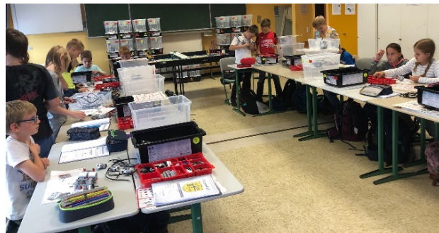
Abb.: Schülerinnen und Schüler im Unterricht